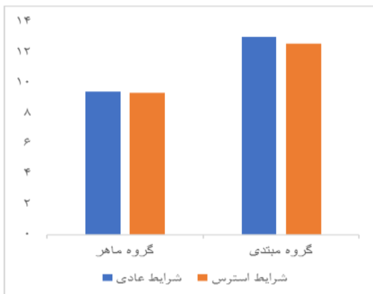
شکل ۱. نمودار عملکرد هماهنگی شانه- آرنج گروه‌ها در مراحل مختلف

آزمون شاپیرو ویلک نرمال بودن داده‌ها را نشان داد، همه P > 0/05 . همچنین آزمون لون نیز نشان‌دهنده همگنی واریانس‌ها بود، P > 0/05 . همه شرکت‌کنندگان به‌صورت مصاحبه شفاهی عنوان