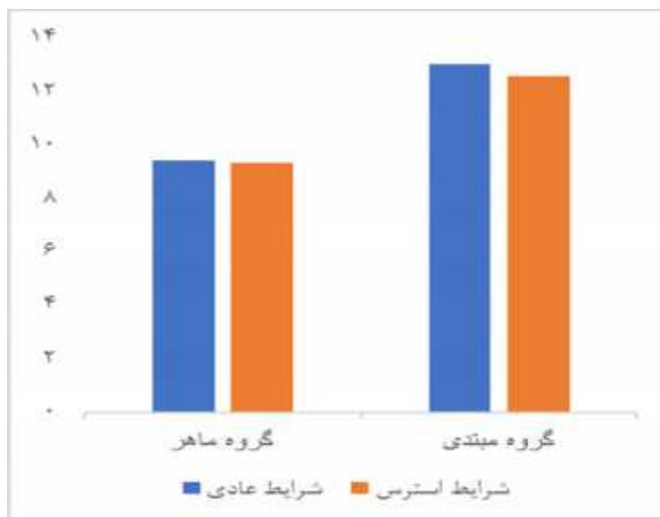
شکل ۱. نمودار عملکرد هماهنگی شانه- آرنج گروه‌ها در مراحل مختلف

آزمون شاپیرو ویلک نرمال بودن داده‌ها را نشان داد، همه P > 0/05 . همچنین آزمون لون نیز نشان‌دهنده همگنی واریانس‌ها بود، P > 0/05 . همه شرکت‌کنندگان به‌صورت مصاحبه شفاهی عنوان