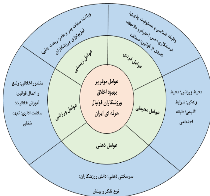
شکل ۱- عوامل مؤثر بر بهبود اخلاق ورزشکاران فوتبال حرفه ای ایران

در جهت بررسی و ارزیابی مدل پژوهش، از آزمون معادلات ساختاری استفاده گردید. شکل شماره ۲ و ۳ و جدول شماره ۱ مدل ساختاری و اندازه گیری مربوط به عوامل را به نمایش گذاشته است.